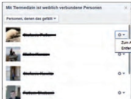
Abb. 4 Einen Fan können Sie blockieren, indem Sie als Administrator auf die „Gefällt mir“-Angaben Ihrer Seite klicken und den Fan dort „entfernen“.

haften allerdings als Praxisinhaber, wenn: