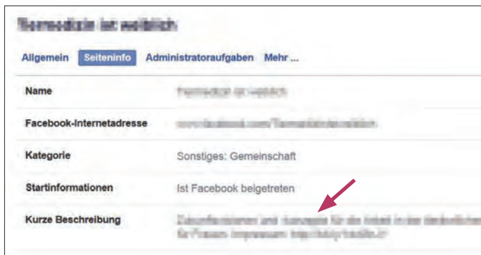
Abb. 5b Unter „Kurze Beschreibung“ kann nun der Link auf das Impressum der eigenen Praxis-Website gesetzt werden.