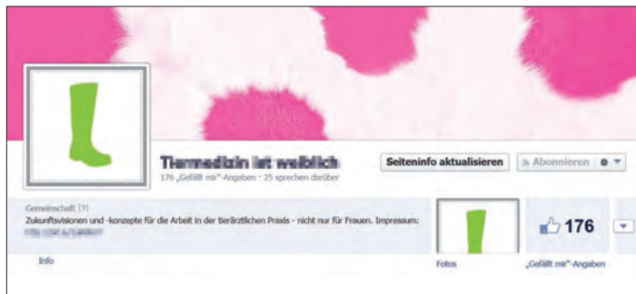
Abb. 5a Um ein Impressum anzulegen, klicken Sie zunächst auf das Info-Feld links.