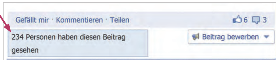
Abb. 2 Wie viele Facebook-Nutzer einen Beitrag gesehen haben, können Sie für jeden einzelnen Beitrag ablesen.

tion der Fans mit der eigenen Seite. Nur so können Sie Ihre Reichweite erhöhen (s. „Edgerank“) und Ihre Patientenbesitzer an Ihre Praxis binden.